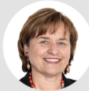
Marina Carobbio Guscetti Staatsrätin des Kantons Tessin, Direktorin Departement für Bildung, Kultur und Sport